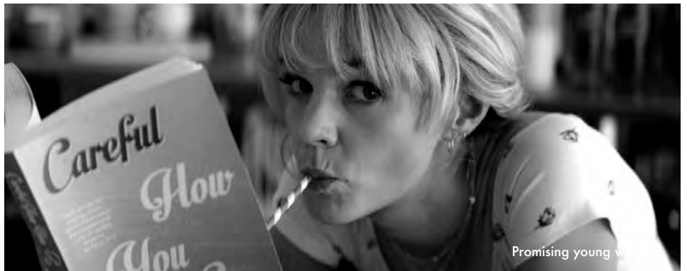
Promising young W